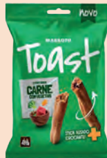
Petisco Maskoto Toast Para Caes Sabor Churrasco 50g