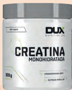
Creatina Monohidratada Dux Nutrition 300g