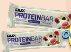
Barra de Proteína Dux Nutrition Chocolate Branco e Frutas Vermelhas 60g