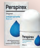
Desodorante Roll-On Perspirex Strong 20ml