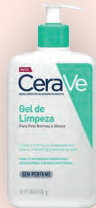
Gel de Limpeza CeraVe Facial 454g