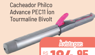
Cacheador Philco Advance PEC11 Ion Tourmaline Bivolt

À vista por: R$ 199,95 cada ou 3X s/juros de R$ 66,65 cada