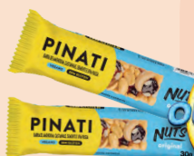
Barra Cereal Pinati Nuts Original 30g