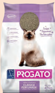
Areia Sanitária Higiênica Proгато Clássica Grãos Pequenos 2kg