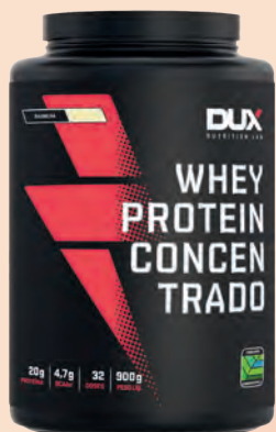
Pote Whey Protein Dux Nutricion Concentrada 900g