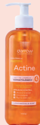
Gel de Limpeza Actine Vitamina C Peles Oleosas a Acneica 400g