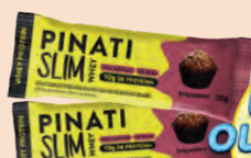
Barra de Proteína Pinati Slim Whey Brigadeiro Sem Açúcar 35g