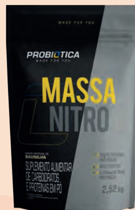
Massa Nitro Baunilha Refil 2,52kg