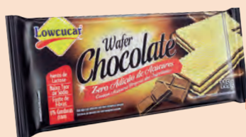
Wafer Chocolate Lowcucar Zero Açúcar 115g