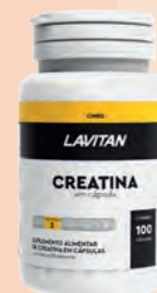
Suplemento Alimentar Lavitan Creatina 100 Cápsulas