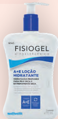
Loção Hidratante Fisiogel A+E 475ml