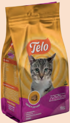
Ração Telo Cat Adulto Carne e Cereais 1kg