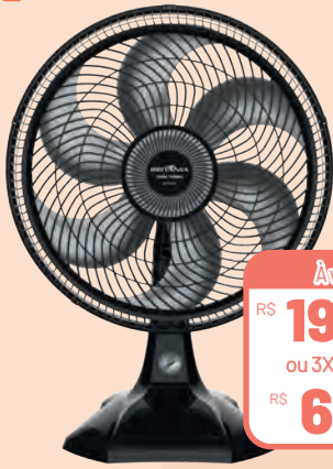
Ventilador Britânia 2 em 1 BVT400 Maxx Force 127V

À vista por: R$ 199,95 cada ou 3X s/juros de R$ 66,65 cada